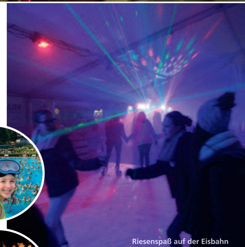
Riesenspaß auf der Eisbahn

Und im Dezember warten der Weihnachtsmarkt und die Eisbahn auf Sie und hüllen Bad Schwalbach in den ersten Winterzauber.