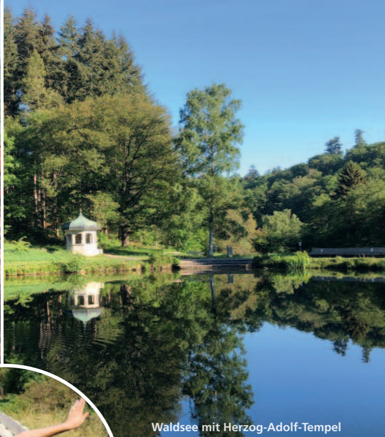
Waldsee mit Herzog-Adolf-Tempel