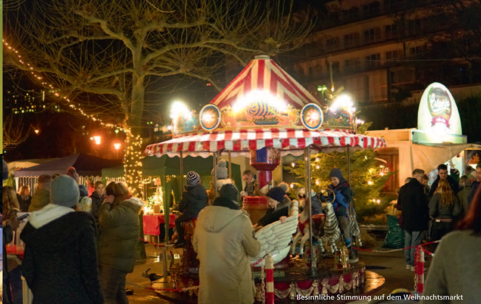
Besinnliche Stimmung auf dem Weihnachtsmarkt

Ende Juli steht alles im Zeichen des wunderschönen Kurparks – hier findet das zweitägige Sommernachtsfest mit Kunsthändler-Markt statt. Unsere Gäste erwartet ein buntes Fest inmitten schöner Natur mit Live-Musik, toller Beleuchtung und romantischem Feuerwerk sowie ein Familientag mit dem beliebten Kunst-Handwerkermarkt und Unterhaltung für die Kids.