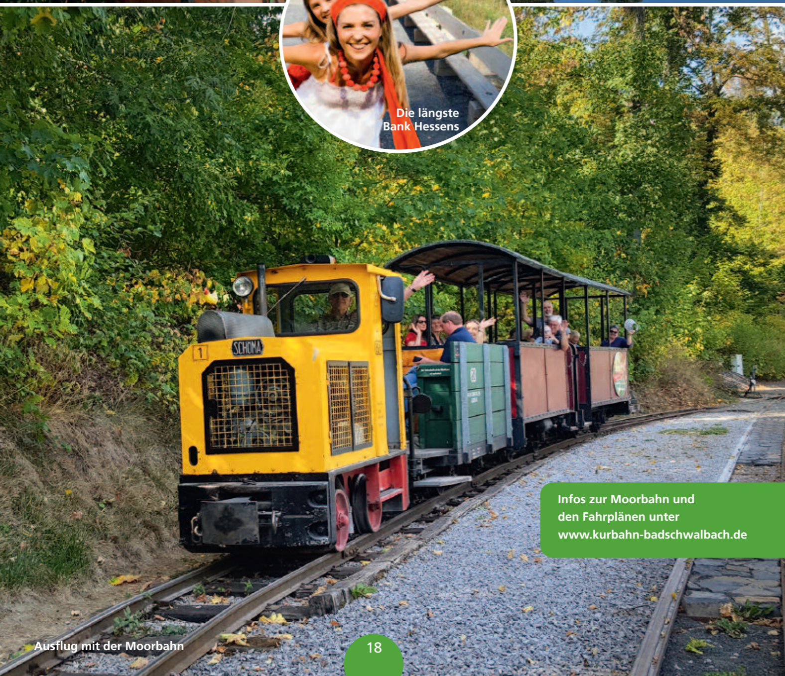
Ausflug mit der Moorbahn