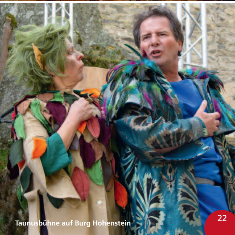
Taunusbühne auf Burg Hohenstein

Das Kur-Stadt-Apothekenmuseum hinter dem Rathaus mit seiner in der Region einmaligen Museumsapotheke, der Ausstellung zur Kurgeschichte, den Originalfunden eines 2500 Jahre alten Keltengrabes und der historischen Druckerei ist ein attraktives Besuchsziel. Regelmäßige Sonderausstellungen und Konzerte runden das Programm ab. Ob Tabletten selbst herstellen oder heiraten – hier ist einiges möglich! Das Museum ist barrierefrei.