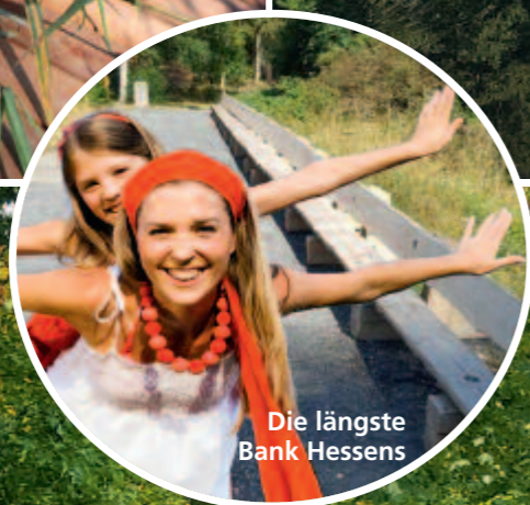
Die längste Bank Hessens