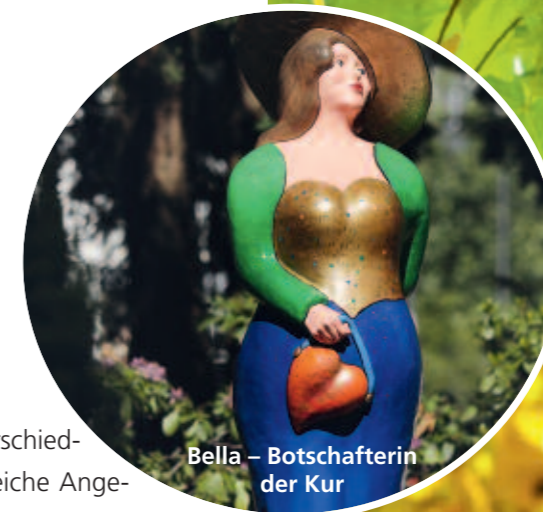
Bella - Botschafterin der Kur

Weitere Infos für Ihren Weg zur Kur: www.bad-schwalbach.de/wegzurkur www.bad-schwalbach.de/badearzt