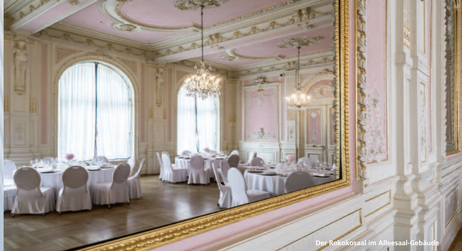
Der Rokokosaal im Alleesaal-Gebäude

Einmal genoss das Wollweberdorf „Langinswalbach“ ein bescheidenes Auskommen. Dann hörte der Arzt Jacob Theodor von der Heilkraft der Quellen . Sein Buch „Neuw Wasserschatz“ (1581) ließ das Städtchen berühmt und zur Kur-Residenz des Hochadels werden. Heilwasser in Fässern und Krügen wurde in alle Welt verschickt. Nach politischen Umbrüchen erfolgte erst im 19. Jahrhundert eine zweite Blüte des Kurbetriebs.