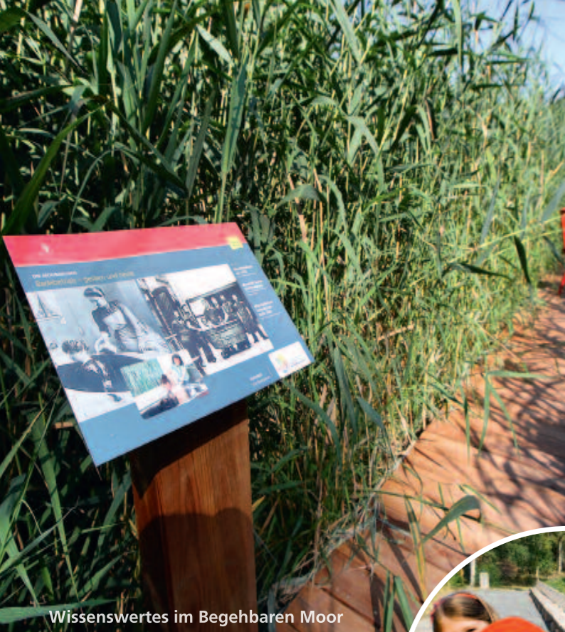
Wissenswertes im Begehbaren Moor