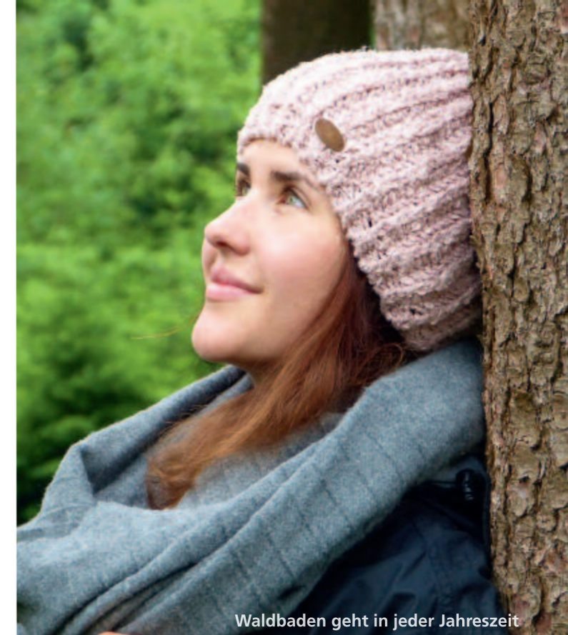
Waldbaden geht in jeder Jahreszeit

Die meisten Unternehmungen sind zu Fuß erreichbar und können für einen schönen Tag in Bad Schwalbach ganz einfach beliebig miteinander kombiniert werden!