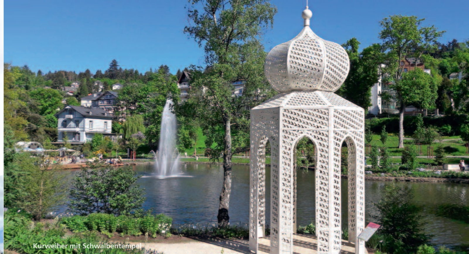
Kurweiher mit Schwalbentempel

Die Kreisstadt des Rheingau-Taunus-Kreises mit ihren 12.000 Einwohnern liegt idyllisch mitten im Naturpark Rhein-Taunus. Ideal für alle, die die Natur lieben, denn ob wunderschöne Wandertouren, Führungen durch die Stadt und den Kurpark, Spaziergänge rund um die sieben Stadtteile oder die Seele baumeln lassen auf dem Waldbadepfad – hier findet jeder das Richtige!