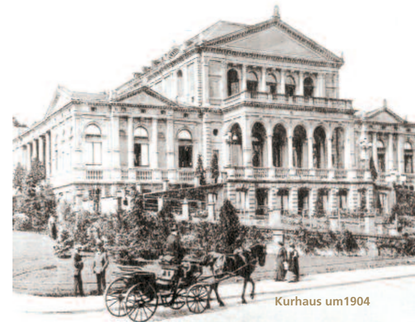
Kurhaus um 1904

Mehr zur Historie: www.bad-schwalbach.de/historie Mehr zu den Kulturbotschaftern: www.bad-schwalbach.de/kulturbotschafter