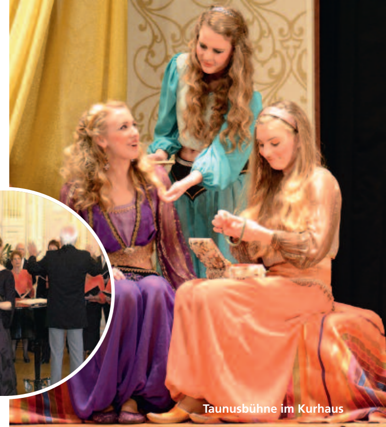
Taunusbühne im Kurhaus