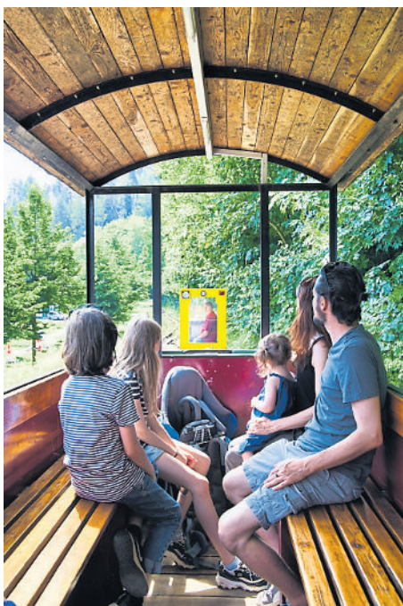
Sommerliches Kurbahnvergnügen

Das Moorbähnchen bringt wieder Gäste zu den Bad Schwalbacher Moorgruben