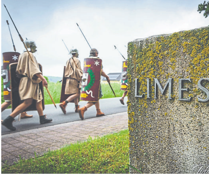
„Römer“ auf dem Limesmarsch.