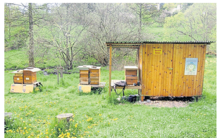
Das Vereinsgelände der Imker im Rötchelbachtal.