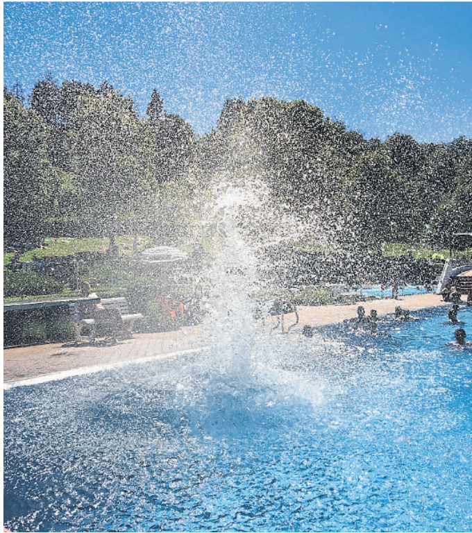
Arschbomben – das spritzt!

Der traditionelle Arschbomben-Wettstreit steht am Samstag, 29. Juli, 14 Uhr auf dem Plan: Wer macht die spektakulärste Arschbombe vom Dreimeterbrett? Zur beliebten Familien-Camping-Nacht lädt das Freibad für Samstag, 19. August, ein. Übernachten mit der ganzen Familie im eigenen Zelt ab 19.15 Uhr, Grillen und Baden bis 22 Uhr. Frühstück gegen Aufpreis. Kinder bis