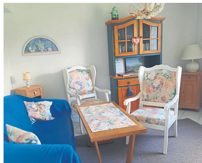
Das Ferienwohnzimmer in der Eichendorffstraße 18.

WLAN gibt es in dieser Wohnung nicht, was aber der Belegung, wie Adolf Pus-