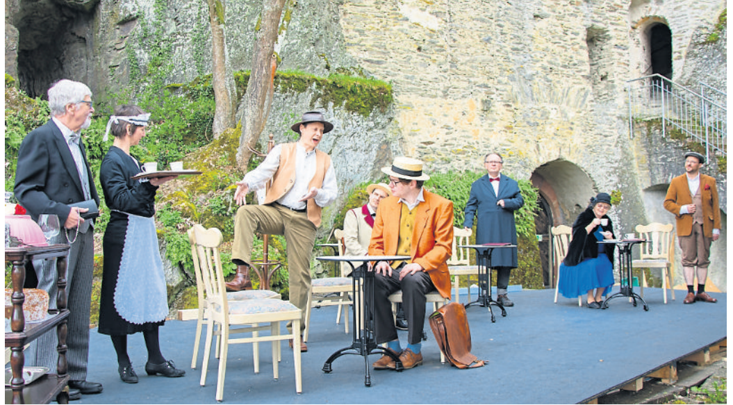
Turbulent geht es zu in der „Pension Schöller“ auf Burg Hohenstein.

Sommerstück der Taunusbühne: „Pension Schöller“