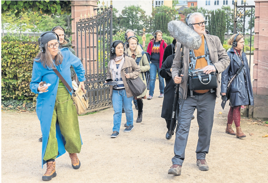
Rauschen, Plätschern, Glucksen im Kopfhörer.

Denn Wasser macht Geräusche: Glucksen, Blubbern, Plätschern, Brizzeln, Rauschen, Prasseln und Tröpfeln entfalten anregende Wirkung auf Körper und Geist. Die Geräuschespezialisten des Liquid Penguin Ensembles komponieren diese Wohlklänge zu einer veritablen akustischen Wasseranwendung für die Ohren, die sie ihrem Publikum entlang eines Parcours durch die Kurparks charmant verabreichen.