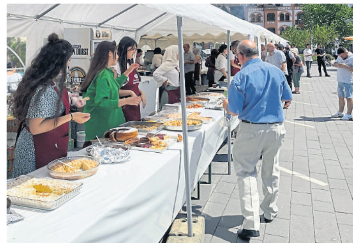
Da macht schon das Anschauen hungrig

Es beginnt am Samstag, 1. Juli, gegen 10 Uhr und dauert bis 22 Uhr. Am Sonntag, 2. Juli, startet es ebenfalls um 10 Uhr, endet aber früher, weil abends noch abgebaut und der Schmidtbergplatz wieder freigemacht werden muss. Multikulturell gefeiert wird auf dem Platz und in mehreren Zelten. Es wird gegrillt, allerlei Getränke werden feilgeboten. Es gibt Spiele für Kinder und