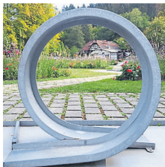
Der beliebte Minigolfplatz im Kurpark lädt wieder ein.

Mehr Infos & Preise: www.bad-schwalbach.de/minigolf