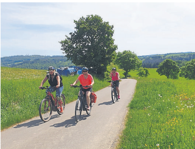
Mit dem E-Bike durch den Taunus.

Gruppenführungen für Schulen, Kindergärten, Vereine und Firmen