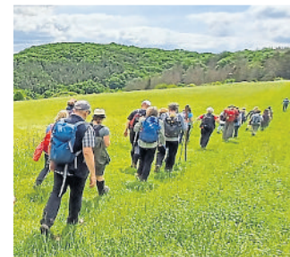
Wanderer an der Aarschleife bei Burg Hohenstein.

Nun wird für das Vorhaben ein Logo für die Beschilderung entwickelt. All das wird noch eine Weile dau