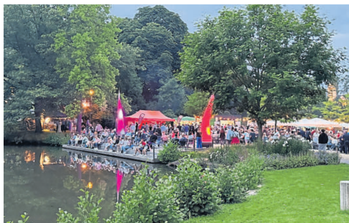
Beste Partystimmung erwartet die Besucher des Bad Schwalbacher Sommernachtsfests.

Der Kunsthandwerker-Markt öffnet am Sonntag, 2. August, von 12 bis 19 Uhr. Dazu gibt es musikalische Unterhaltung von „CH Party