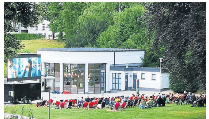
Open-Air im Kurpark im Jahr 2022.

Ergänzt wird das Kino durch ein vielseitiges Rahmenprogramm: Am Freitag, 3. Juli, bringt „Just Queen“ die größten Hits der legendären Band auf die Bühne. Am Samstag, 4. Juli, lädt der Tag der Vereine