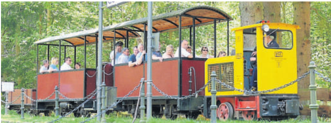
Immer wieder ein Vergnügen: die Kurbahn Bad Schwalbach.

Erwachsene zahlen 4 Euro, Kinder bis 14 Jahre 2 Euro, Familien (zwei Erwachsene und bis zu drei Kindern) 9 Euro. Kinder unter vier Jahren werden kostenlos befördert, wenn sie auf dem Schoß eines Erwachsenen mitfahren. Veranstalter ist der Verein Bad Schwalbacher Kurbahn e. V., www.kurbahnbadschwalbach.de