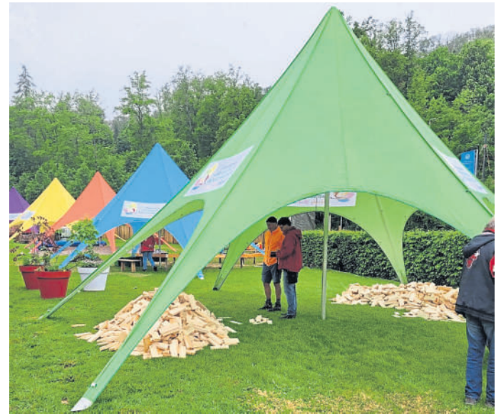
Szene aus einem früheren Gartenfestival.