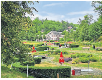
Die Minigolfanlage im hinteren Kurpark.

Sommerzeit - Minigolfzeit. Die 18-Bahnen-Anlage im Kurpark bietet wieder Spiel, Spaß und kleine sportliche Herausforderun-