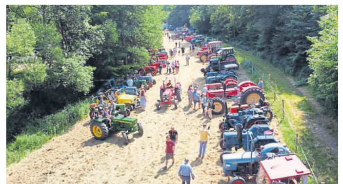
Das historische Traktortreffen im vergangenen Jahr in Fischbach.

Hettelhain. Ein Freizeitmannschaften-Turnier des 1. FCH findet am Samstag, 13.