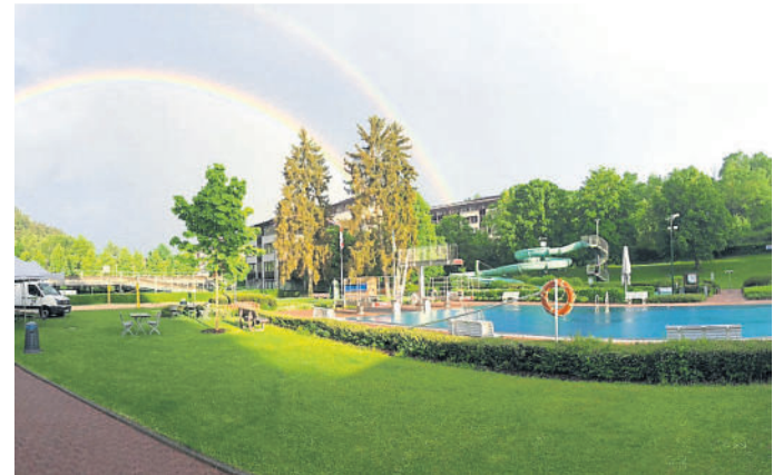
Das Freibad im Heimbachtal lockt den Sommer über wieder mit zahlreichen Attraktionen.

Ein Modellboot-Abend ist für Samstag, 18. Juli, geplant. Von 19.30 bis 23.30 Uhr ist das Wasserbecken für elektrisch betriebene Boote und Schiffe reserviert. Eine Anmeldung ist nicht erforderlich. Am Freitag, 7. August, startet um 20 Uhr eine Party zum Ferienende.