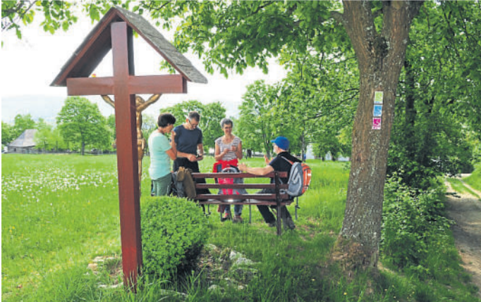
Wanderstopp am Wispertaler Krönchen.

Nachzertifizierung durch das Deutsche Wanderinstitut