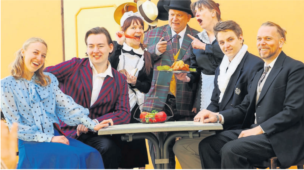
Hier läuft es gründlich aus dem Ruder. Szene aus dem „Doppelgänger“.

Taunusbühne: Theater für Kinder, Familien und Erwachsene