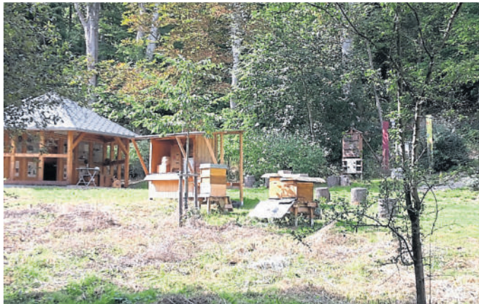
Das Gelände des Bad Schwalbacher Imkervereins.

Festes Schuhwerk wird empfohlen, wenn möglich lange Hosen und dem Wetter angepasste Kleidung. Personen, die an einer Bienengiftallergie leiden, werden gebeten, ihr Notfallset mitzuführen