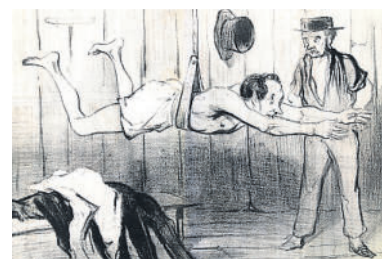
Honoré Daumier: Die Badenden, Trockenübung.

Der Humor der Künstler ist tiefgründig und musste seinen Weg durch die oft strenge Zensur finden. Mit satirischem Blick verarbeiteten sie politisch oder gesell-