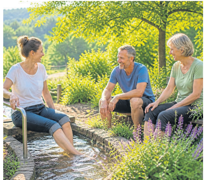
Kneipp in seiner ganzen Vielfalt.

Ein besonderer Höhepunkt des Sommers ist das große Kneipp-Jubiläumsfest am 15. August im Heilpflanzengarten in Bad Schwalbach. Besucherinnen und Besucher erwartet ein buntes Programm für die ganze Familie. Unter dem Motto „Mitmachen, entdecken und genießen“ können die fünf Kneipp'schen Elemente an verschiedenen Stationen aktiv erlebt werden. Ob Bar-