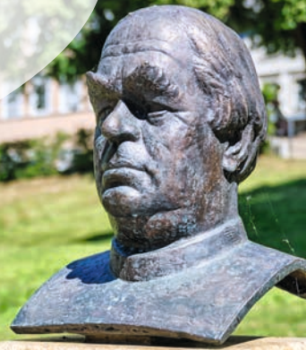
SEBASTIAN KNEIPP 1821 - 1897

„Die Natur ist die beste Apotheke“ (Sebastian Kneipp, 1821-1897)