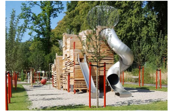
Spielplatz „Obstkiste“ im Röthelbachtal

WWW.BAD-SCHWALBACH.DE/FREIZEIT-TOURISMUS