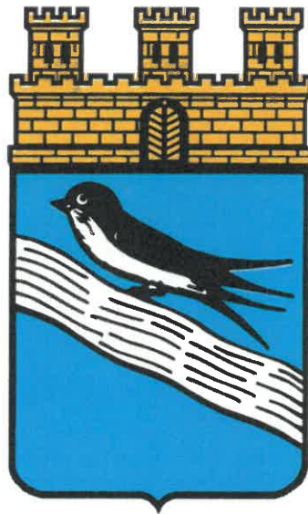
Stadt Bad Schwalbach

Bürgerhaus Fischbach Rheingauer Str.5 65307 Bad Schwalbach-Fischbach